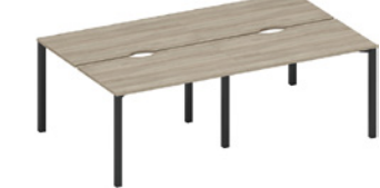
рабочая станция с вырезами на металлокаркасе

A1 ЧР 173.2-2 ВЛ 240x144x75 A1 ЧР 174.2-2 ВЛ 280x144x75 A1 ЧР 175.2-2 ВЛ 320x144x75