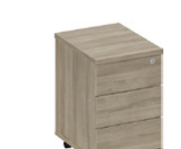
тумба выкатная 3-яичичная с центральным замком узкая