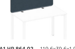
экран фронтальный тканевый с кронштейнами

A1 ЧР 864.02 119,6x39,6x2,9 A1 ЧР 865.02 139,6x39,6x2,9 A1 ЧР 866.02 159,6x39,6x2,9 A1 ЧР 867.02 179,6x39,6x2,9