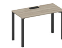
стол письменный с заглушкой на металлокаркасе

A1 ЧР 013 ВЛ 120x70x75 A1 ЧР 014 ВЛ 140x70x75 A1 ЧР 015 ВЛ 160x70x75