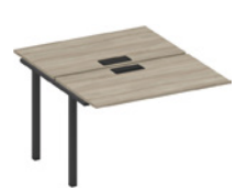
секция стола рабочей станции с заглушками на металлокаркасе

A1 ЧР 173-1 ВЛ 120x144x75 A1 ЧР 174-1 ВЛ 140x144x75 A1 ЧР 175-1 ВЛ 160x144x75