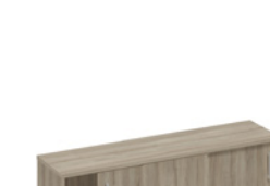
шкаф-купе низкий (для двух столов 70)