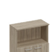
шкаф средний полуоткрытый