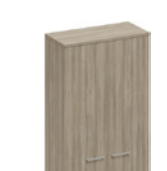
шкаф для одежды