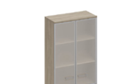
шкаф для документов со стеклянными дверьми в алюминиевой рамке