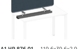
экран фронтальный тканевый с мягким наполнителем с кабель-каналом

A1 ЧР 876.01 119,6x39,6x2,9 A1 ЧР 877.01 139,6x39,6x2,9 A1 ЧР 878.01 159,6x39,6x2,9 A1 ЧР 879.01 179,6x39,6x2,9