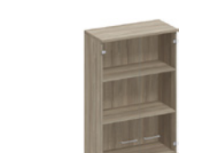
шкаф для документов со стеклянными дверьми