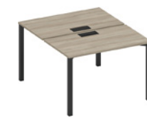
рабочая станция с заглушками на металлокаркасе

A1 ЧР 173 ВЛ 120x144x75 A1 ЧР 174 ВЛ 140x144x75 A1 ЧР 175 ВЛ 160x144x75