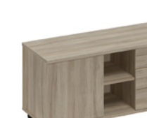
тумба для оргтехники