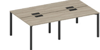
рабочая станция с заглушками на металлокаркасе

A1 ЧР 173-2 ВЛ 240x144x75 A1 ЧР 174-2 ВЛ 280x144x75 A1 ЧР 175-2 ВЛ 320x144x75