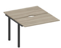
секция стола рабочей станции с вырезами на металлокаркасе

A1 ЧР 173.2-1 ВЛ 120x144x75 A1 ЧР 174.2-1 ВЛ 140x144x75 A1 ЧР 175.2-1 ВЛ 160x144x75