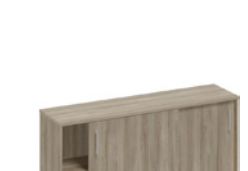
шкаф-купе средний (для двух столов 70)