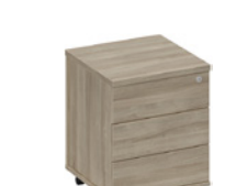
тумба выкатная 3-яичичная с замком / с центральным замком